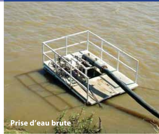
Prise d'eau brute