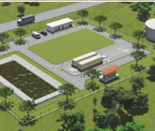
Les installations SafeDrink sont faciles à agrandir ultérieurement