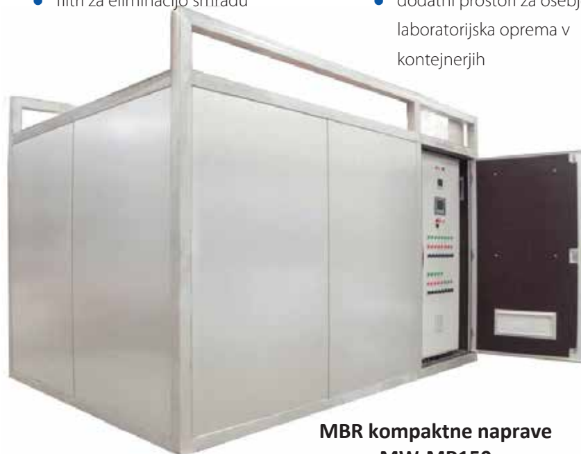
MBR kompaktne naprave MW-MR150