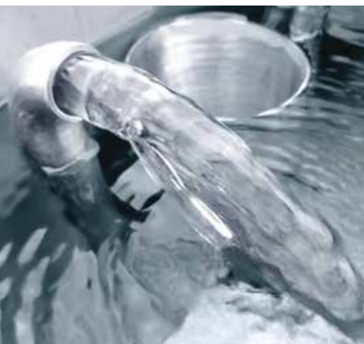
očišćena voda na izlazu