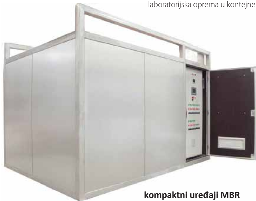
kompaktni uređaji MBR MW-MR150