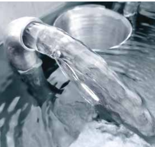
Eau claire purifiée