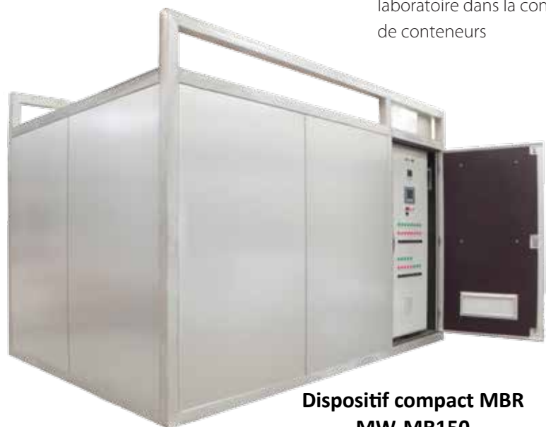
Dispositif compact MBR MW-MR150